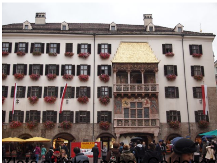
Dachl v Innsbrucku

Středa, 26 Říjen 2016 12:50 - Aktualizováno Čtvrtek, 27 Říjen 2016 08:20