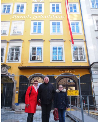
Podnědím W. A. Mozarta v Obilní ulici v Salzburgu