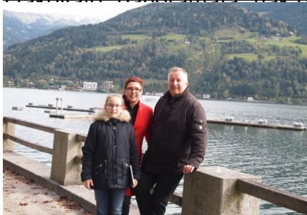
V Zell am See jsme měli čas i na krátkou procházku kolem jezera