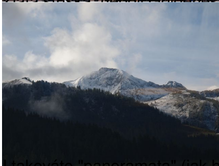
(přesněji řečeno, jak jsem řekla pí Homolková) byla vidět z vlaku