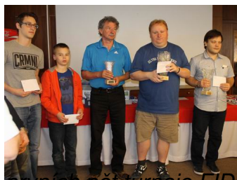
prvních pět turnaje FIDE Open

Pondělí, 25 Květen 2015 17:56 - Aktualizováno Pondělí, 25 Květen 2015 18:30