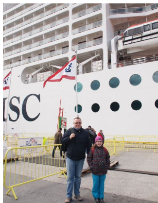
Nastupujeme na loď MSC Orchestra

Neděle, 21 Červen 2015 15:15 - Aktualizováno Úterý, 11 Srpen 2015 10:31