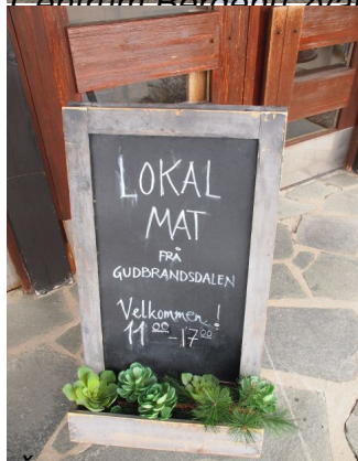
Čeká nás snad po vstupu do hotelu Grolti mat?