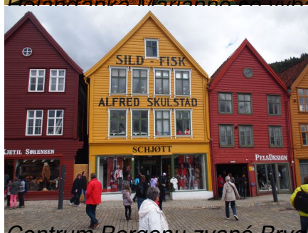
Centrum Bergenu zvané Bryggen je zapsáno v Seznamu UNESCO